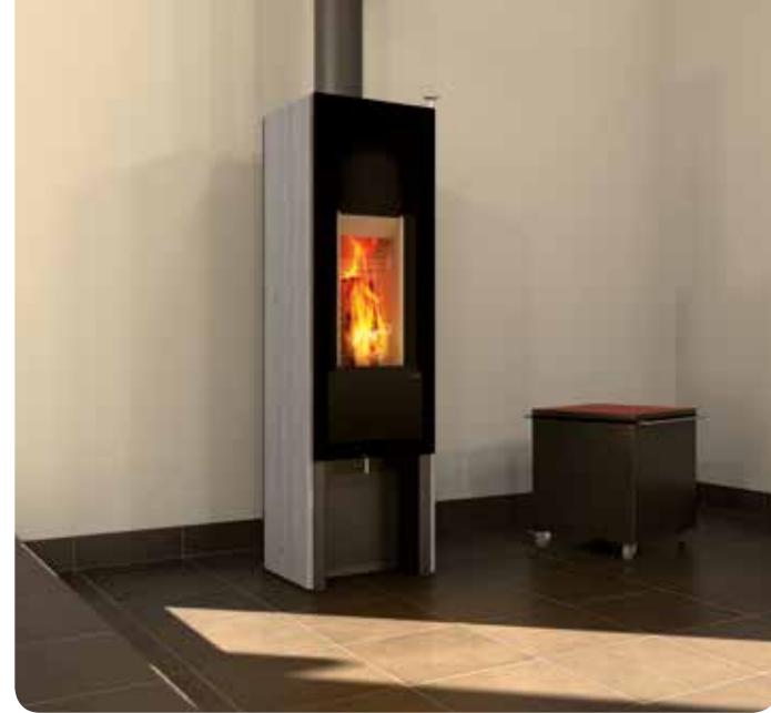
Design: GAAN Gabriela Vetsch, André Riemens

Sie wollen eine platzsparende, aber dennoch elegante Lösung? Der T-ONE SWING besticht mit nach hinten gewölbten, aus gegossenem Stein geformten Seitenwänden. Durch die rahmenlose Glastür, bietet sich Ihnen ungetrübte Sicht auf das einmalige Flammenspiel der aufrecht platzierten Holzscheite. Geniessen Sie bereits kurz nach dem Anfeuern die erste wohlige Wärme, für einen gemütlichen Abend in Ihrem Zuhause.