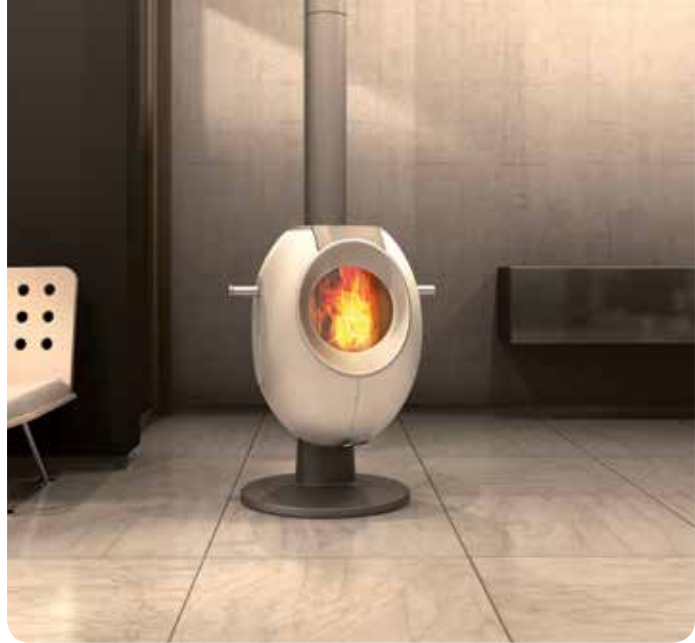
Design: GAAN Gabriela Vetsch, André Riemens

Die kubische Form des T-ONE STONE bringt Ihnen unaufdringliche Eleganz, die gradlinige, schnörkellöse Glasfront modernen Glanz. Das „gewisse Etwas“ ist dabei ein besonderes Extra: Mit dem optionalen Backaufsatz wird der T-ONE STONE zum Gourmet-Ofen. Geniessen Sie so mit bereits einer Holzladung über sechs Stunden wohlige Strahlungswärme, und backen Sie dabei gleichzeitig Pizza, Kuchen, oder ein duftendes Brot!