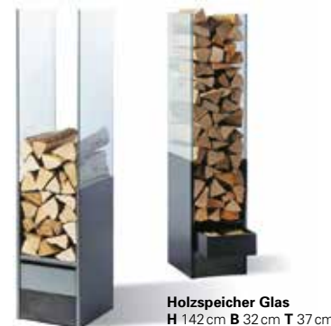
Holzspeicher Glas H 142cm B 32cm T 37cm

Wer sein Feuerholz lieber diskret lagert, für den ist die praktische Holzbox genau das Richtige. So kann man Holz und Kehrgarnitur in separaten Fächern verstauen und hat gleichzeitig einen dekorativen Hocker, dessen Deckel mit Holzfurnier oder farbigem Filz bezogen ist.