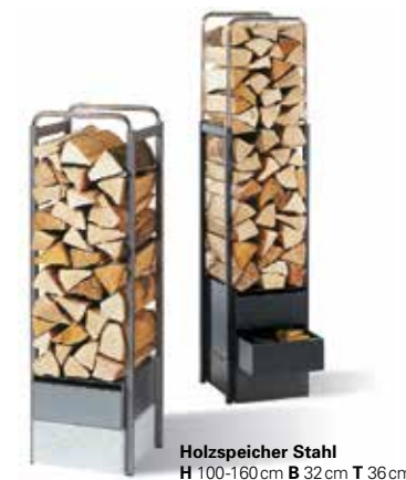
Holzspeicher Stahl H 100-160cm B 32cm T 36cm