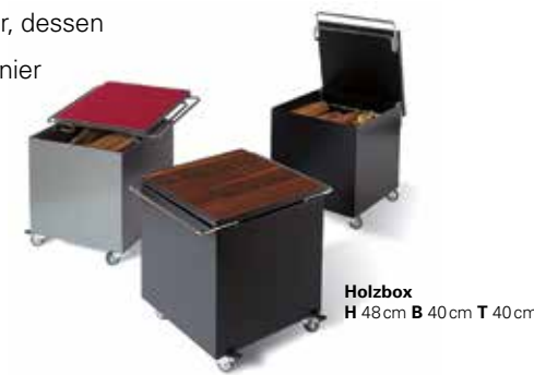
Holzbox H 48cm B 40cm T 40cm