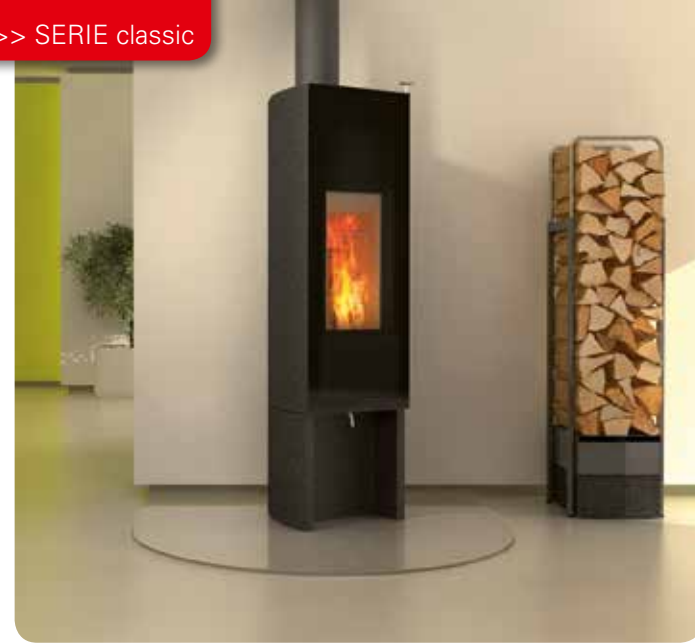
Design: GAAN Gabriela Vetsch, André Riemens