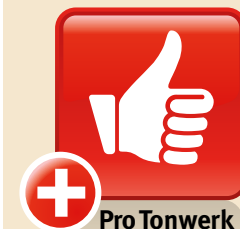
Design: GAAN Gabriela Vetsch, André Riemens